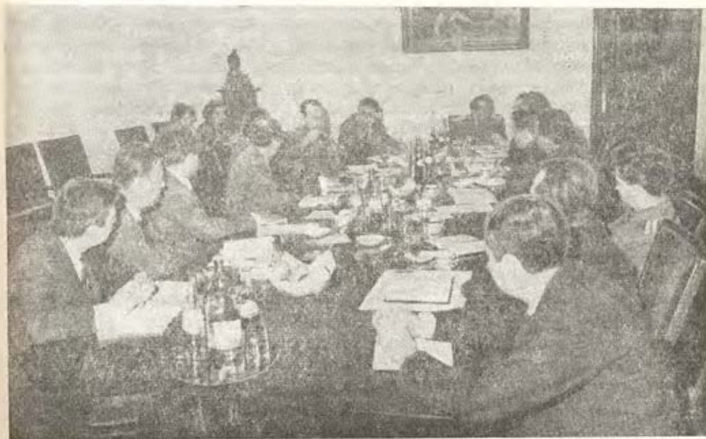
Aspect din timpul discuțiilor

În dorința ca ofițerii de securitate din aparatul central și teritorial să participe în număr cât mai mare la această discuție, trimițând redacției aprecierile, concluziile și propunerile lor, consemnăm în cele ce urmează câteva dintre problemele cele mai importante dezbătute cu prilejul mesei rotunde.